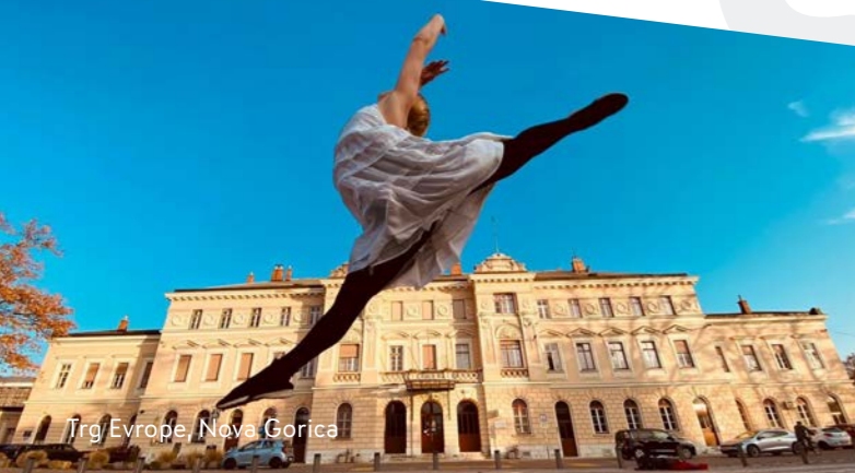
Trg Evrope, Nova Gorica