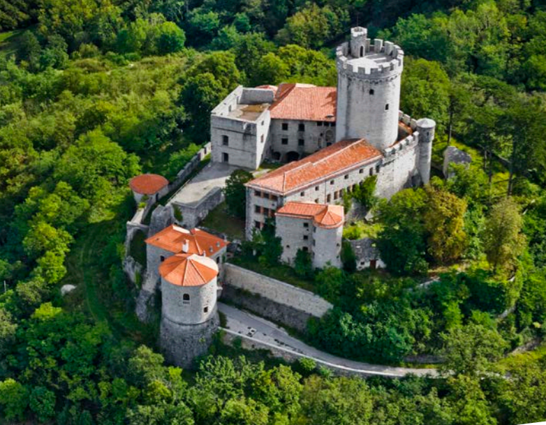
Grad Rihemberk, Branik