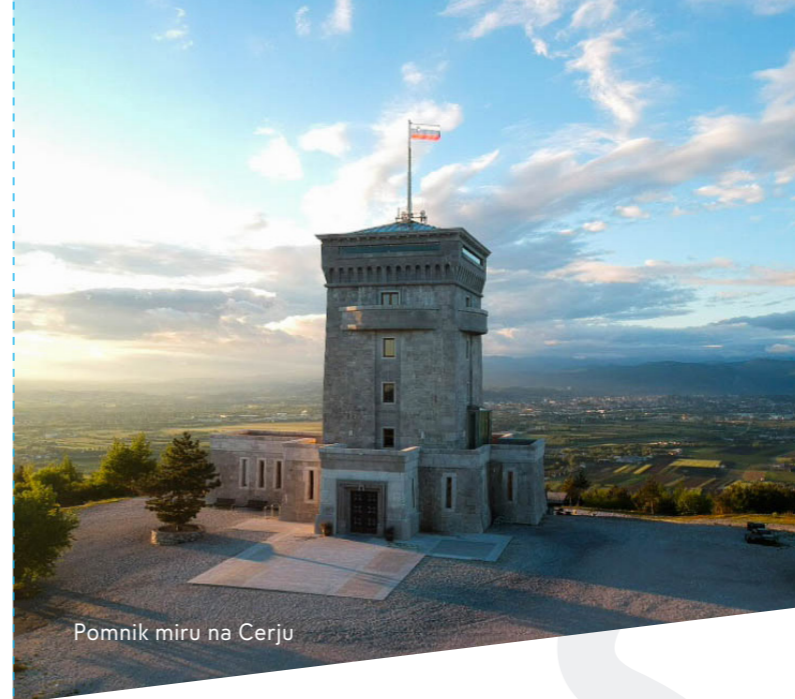
Pomnik miru na Cerju